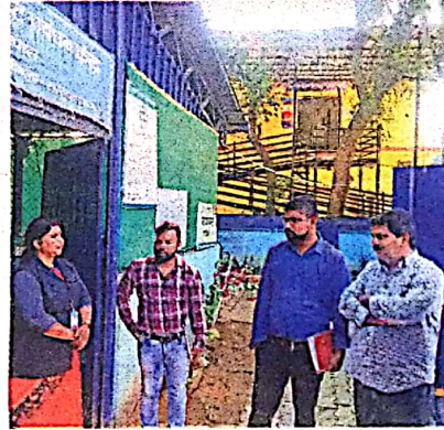
अंबिकापुर के एसएलआरएम सेंटर के कर्मचारियों से बात करती हुई टीम।

आने वाले समय में जगदलपुर शहर को भी अंबिकापुर की तरह जाना जाएगा इसको लेकर यहां की व्यवस्था को दुरुस्त करने के लिए जगदलपुर निगम के चार कर्मचारियों को अंबिकापुर भेजा गया था। इन कर्मचारियों ने यहां की सफाई व्यवस्था को देखा और यहां पर काम करने वाले समूह की महिलाओं से कचरे को सही ढंग से नष्ट करने के उपाय जाने और अब इसे जगदलपुर में शुरू करने की योजना बनाने में जुट गए हैं। दौरे पर कर्मचारियों की मानें तो अंबिकापुर को साफ सुथरा रखने की जिम्मेदारी वहां के नागरिक और निगम दोनों ने उठा रखी है।